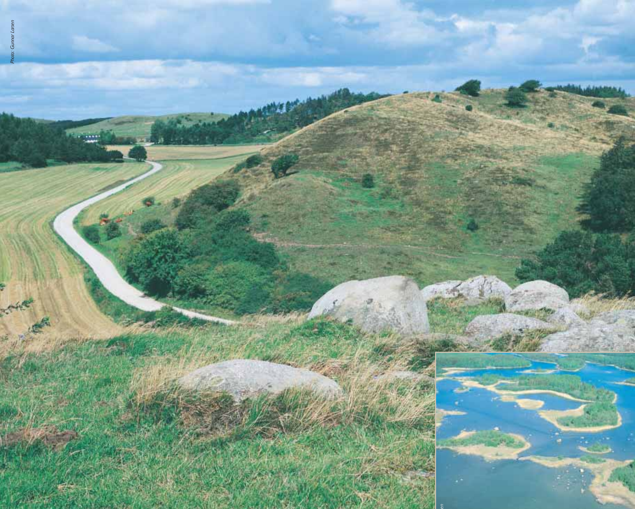
Backlandskap av morän och smältvattensediment, Mols Bjerger, Jylland.